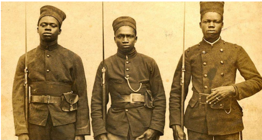
Fot. 2. Strzelcy Senegalscy

Był to okres odrodzenia populacji francuskiej, ale wybuch pierwszej wojny światowej spowodował oczywiste spustoszenia całych regionów północnej i wschodniej Francji. Aby poradzić sobie z tą trudną sytuacją, władze francuskie zwróciły się ku imperium kolonialnemu. W ten sposób w 1914 roku tysiące młodych rekrutów wylądowało we Francji, wśród nich także senegalscy żołnierze. W 1857 roku Korpus Strzelców Senegalskich został utworzony przez Louis Faidherbe, gubernatora generalnego Francuskiej Afryki Zachodniej. Żołnierze z tej jednostki zostali określani mianem Strzelców Senegalskich ( Les Tirailleurs Sénégalais ), nie pochodzili tylko z Senegal, również ze wszystkich francuskich kolonii w Afryce. Już w sierpniu 1914 roku 31.000 z nich walczyło na frontach pierwszej wojny światowej w szeregach armii francuskiej.