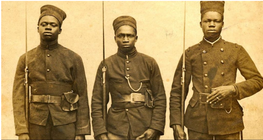
Fot. 2. Strzelcy Senegalscy

Był to okres odrodzenia populacji francuskiej, ale wybuch pierwszej wojny światowej spowodował oczywiste spustoszenia całych regionów północnej i wschodniej Francji. Aby poradzić sobie z tą trudną sytuacją, władze francuskie zwróciły się ku imperium kolonialnemu. W ten sposób w 1914 roku tysiące młodych rekrutów wylądowało we Francji, wśród nich także senegalscy żołnierze. W 1857 roku Korpus Strzelców Senegalskich został utworzony przez Louis Faidherbe, gubernatora generalnego Francuskiej Afryki Zachodniej. Żołnierze z tej jednostki zostali określani mianem Strzelców Senegalskich ( Les Tirailleurs Sénégalais ), nie pochodzili tylko z Senegalu, również ze wszystkich francuskich kolonii w Afryce. Już w sierpniu 1914 roku 31.000 z nich walczyło na frontach pierwszej wojny światowej w szeregach armii francuskiej.