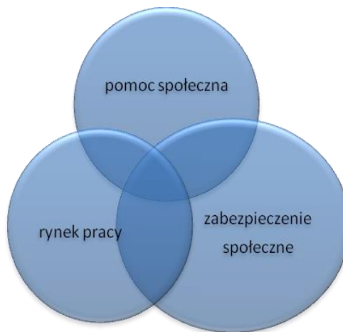
Rys. 1. Podsystemy bezpieczeństwa społecznego w obszarze egzystencji

Biorąc pod uwagę przedstawione definicje bezpieczeństwa, można z systemu bezpieczeństwa społecznego wyodrębnić podsystemy sensu stricto : pomocy społecznej, rynku pracy oraz zabezpieczenia społecznego.