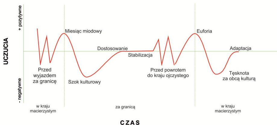
Rys. 2. Fazy procesu akulturacji

Źródło: M. Bartosik-Purgot, Otoczenie w biznesie międzykulturowym , PWE, Warszawa 2006, s. 179.