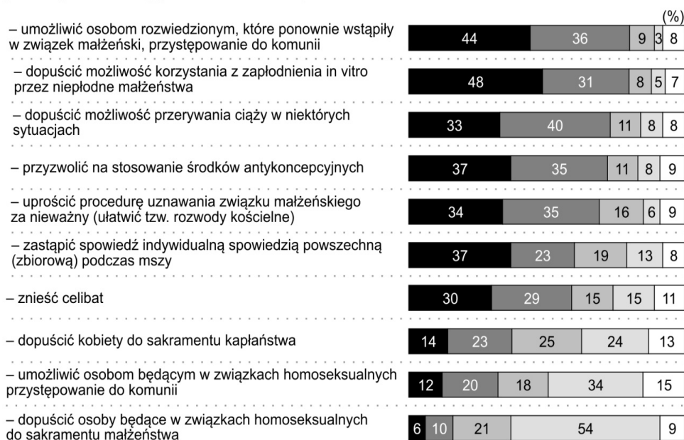
Rys. 2. Czy uważa Pan(i), że Kościół katolicki powinien:

■ Zdecydowanie tak ■ Raczej tak ■ Raczej nie ■ Zdecydowanie nie □ Trudno powiedzieć